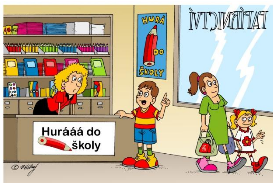
Prosím propisku, která umí psát správně „i“ a „y“

Pravidla mu přinášejí řád a jistotu. Přemíra volnosti, chaos a nejistota jsou pro dítě nesrozumitelné. Když nemá nastavené hranice, snadno je překračuje, a to mu komplikuje život a vztahy ke spolužákům i dospělým. A jak se chová dítě, které se neumí spolehnout samo na sebe, nezná osobní odpovědnost a neustále vyžaduje dohled? Rodičům rozmazleného dítěte zákonitě nastanou problémy, neví si s ním rady, jejich výchovné metody selhávají a místo radosti z dítěte jsou zoufalí a z jeho výchovy unavení.